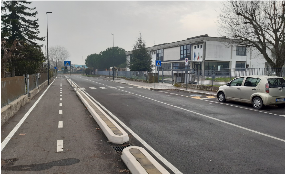
Via Gramsci nei pressi della Scuola Secondaria "G.Pascoli"

Il tessuto urbano è prevalentemente residenziale ed è attualmente in fase di completamento la nuova zona residenziale lungo via della Poesia.