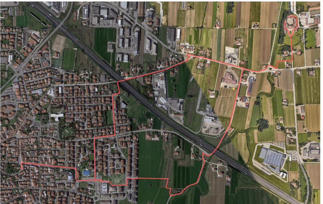
Pista ciclo-pedonale "del Pascoli"