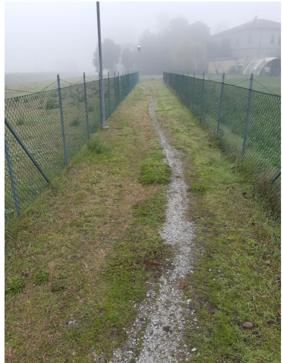
Via Due Martiri verso compendio "la Torre"