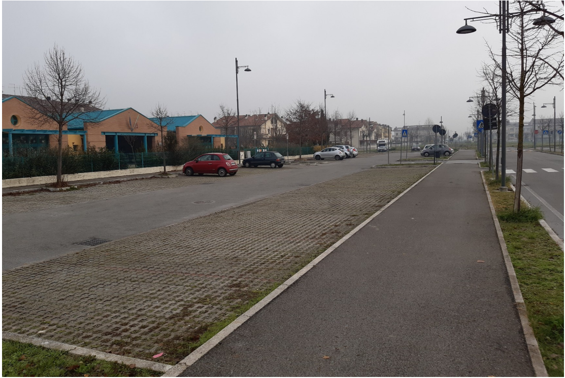
Via il Fanciullino nei pressi della Scuola per l'Infanzia "Il Pettiroso"