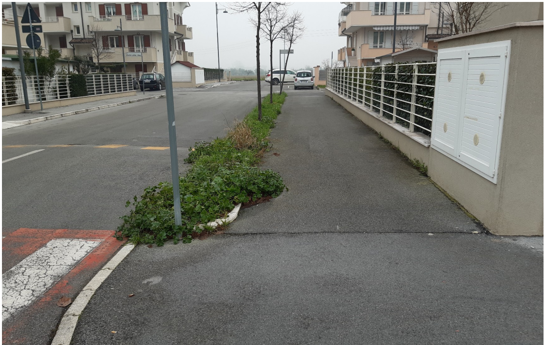
Via Don Milani