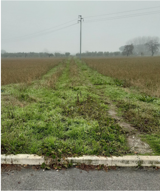
Passaggio interpoderaie esistente soggetto a servitù