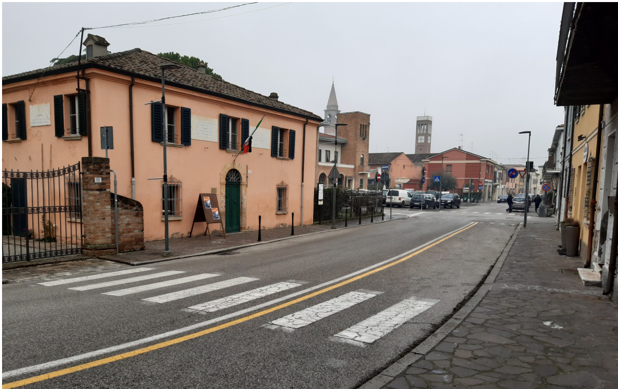
Museo Casa Pascoli

Il percorso andrà infine ad implementare la rete ciclo-turistica dell'Unione Rubicone e Mare prevista dallo studio di fattibilità di cui alla delibera di Giunta dell'Unione n.45 del 20/06/2018, inserendosi sulla direttrice della Greenway del canale Rio Salto (Tavola A1 "Itinerari ciclabili lungo i corsi d'acqua (Greenways) e collegamenti intravallivi" e fascicolo "Rio Salto").