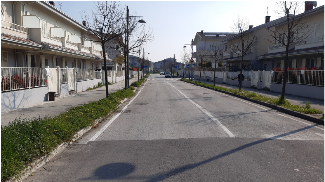
Via della Poesia