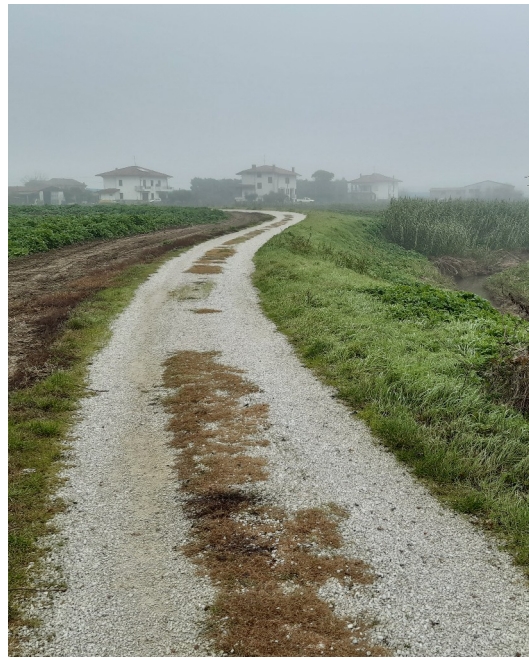
Via Rio Salto II sull'argine del fiume