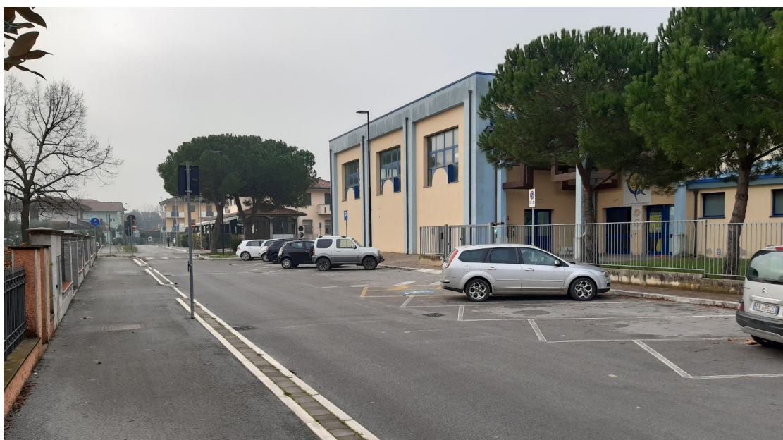
Via Togliatti nei pressi della Palestra della Scuola Secondaria "G.Pascoli"