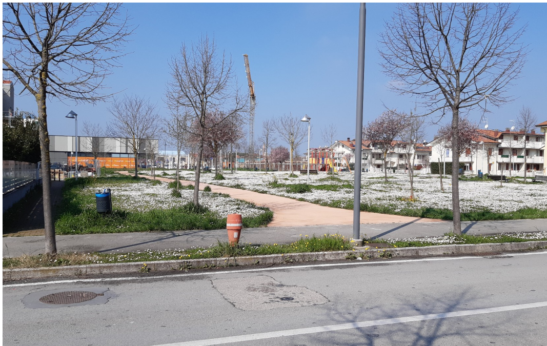
Primo stralcio: parco della Poesia