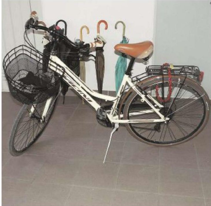
La bici rubata: i carabinieri cercano la proprietaria